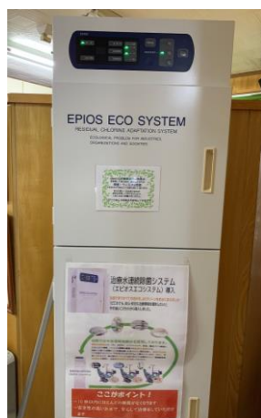
エピオス エコシステム

滅菌にも力を入れています。院内を流れるお水はすべて細菌数 0 になるよう「エピオス エコシステム」を導入し、患者さんに安心して来ていただけることはもちろん、私たち従事者の身を守ることにもつながっています。